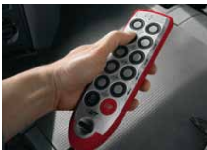
...en option la télécommande avec impulsions à plusieurs étages.