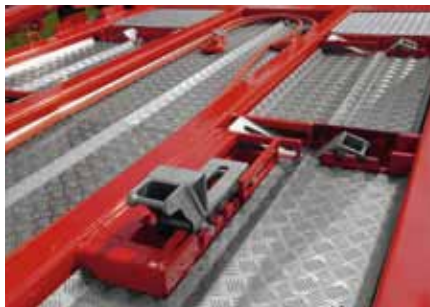
Cales de centrage réglables et escamotables.

avec les types de modèles suivants: 12K/16K/18K/26K/32K