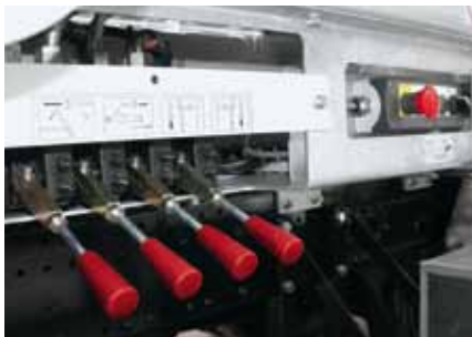
Commande proportionnelle et précise grâce à la technologie Load-sensing.

avec les types de modèles suivants: 12T/16T/18T/26T/32T