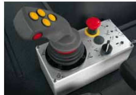
Confort d'utilisation extrêmement élevée avec un Joystick proportionnel dans toutes les fonctions ou...