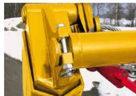
Bras hexagonaux avec traverse facilement démontable.