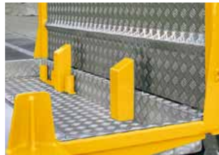
Bac à ustensiles et butées.