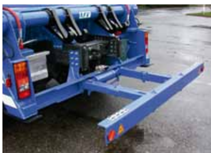
Barre anti-ancastrement télescopique.