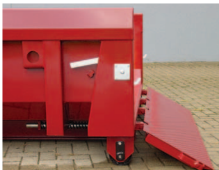
Mit federentlasteter Auffahrrampe