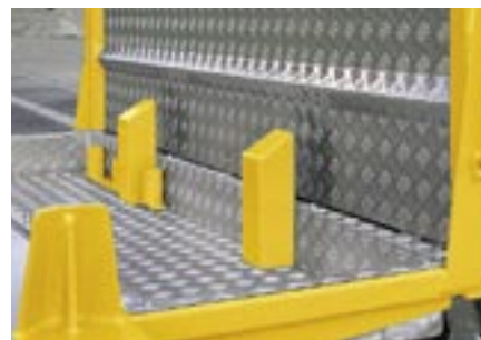
Bac à ustensiles et butées.