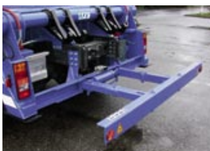
Barre anti-ancastrement télescopique.