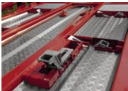
Cales de centrage réglables et escamotables.

avec les types de modèles suivants: 12K/16K/18K/26K/32K